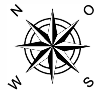
LAGEPLAN - genordet